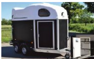
GOLD FIRST + Sellerie